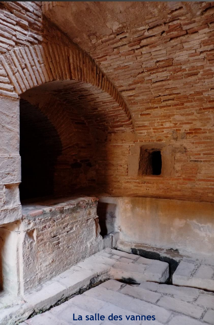
La salle des vannes