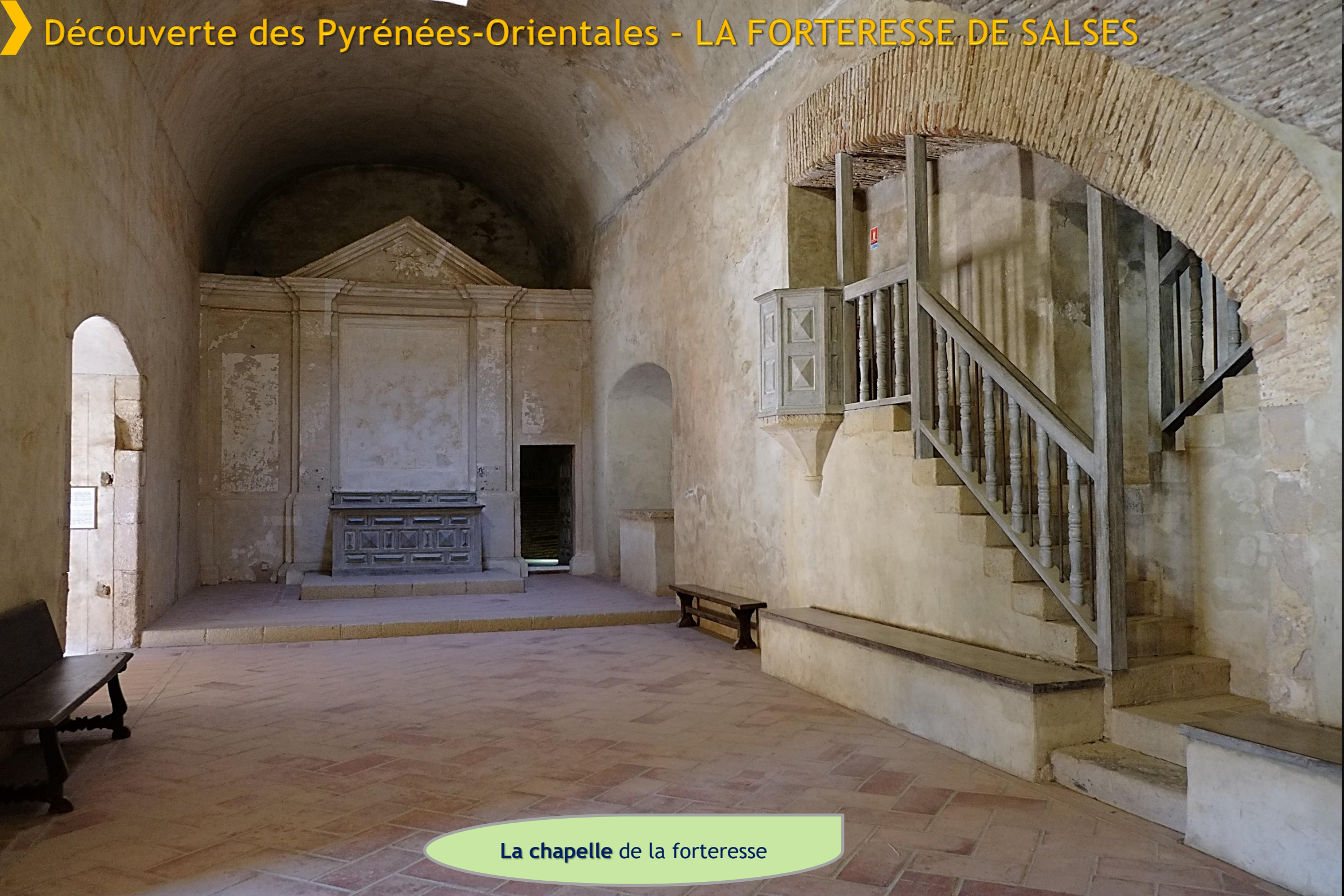
La chapelle de la forteresse