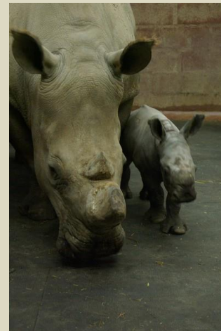
Rhinocéros blanc (avec son petit - 5 jours, né début octobre 2008)