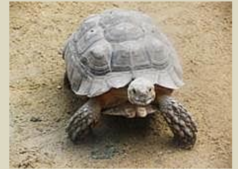
Tortue de terre