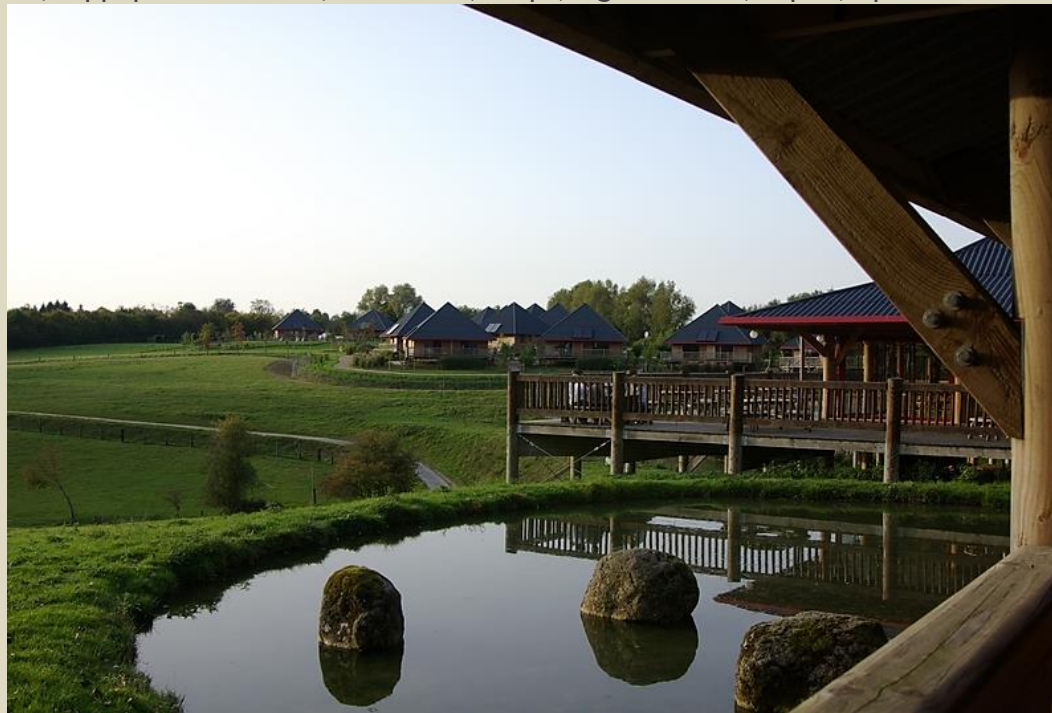
Vue des bungalows sur pilotis et du restaurant