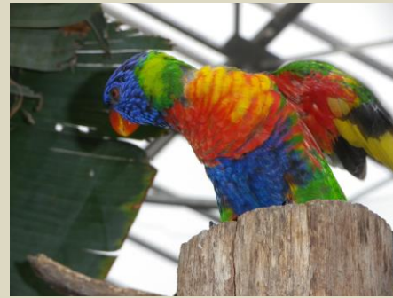
Ne pas donner de pain aux oiseaux