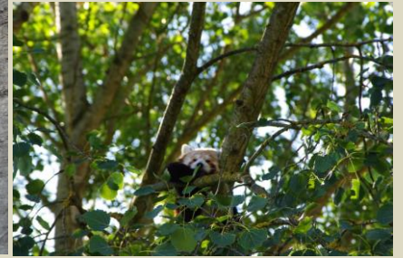
Dans l'arbre un panda roux