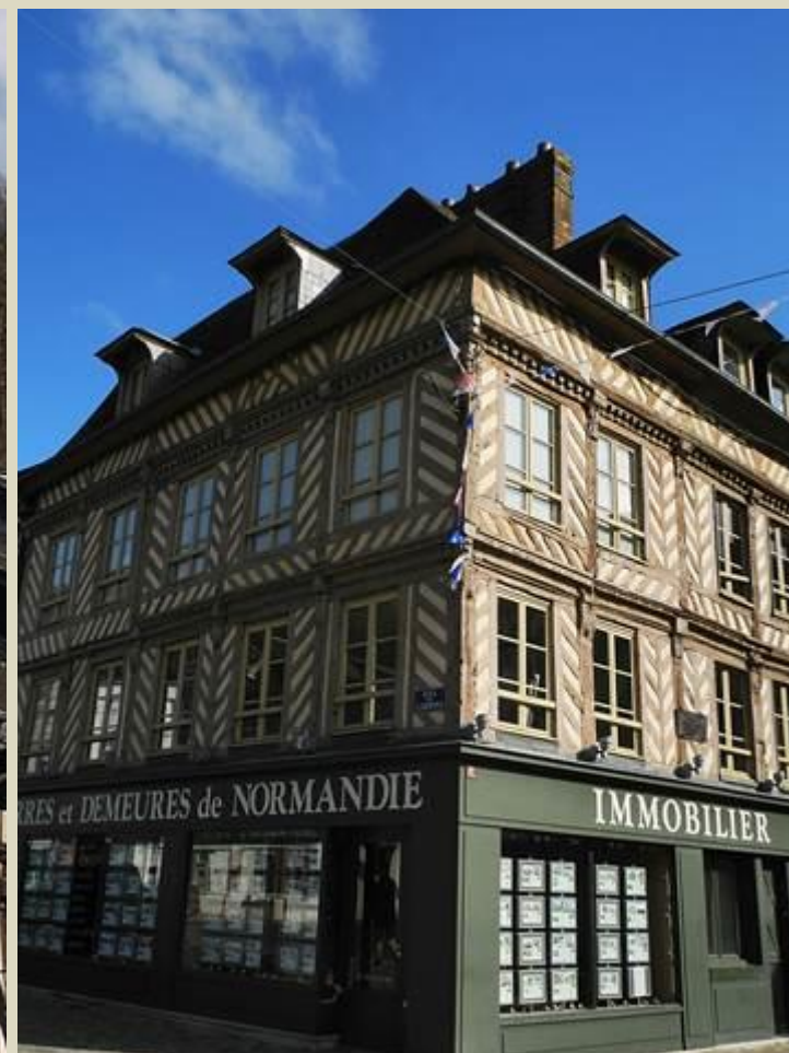
La maison située sur la place du village, photo de droite, a été restauré récemment.