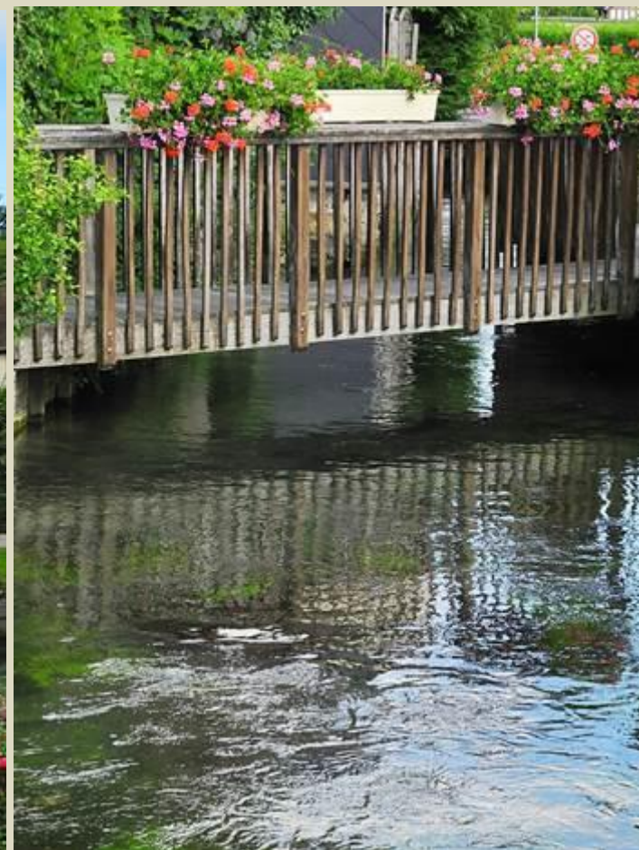
L'ancien lavoir près de la Calonne, rivière qui traverse le village.