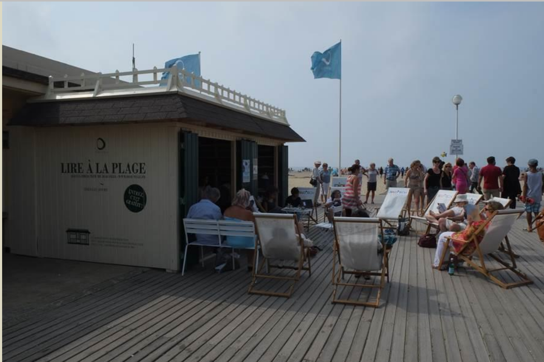
L'été une bibliothèque éphémère en bordure de plage vous offre un moment de lecture sur des transats disposés sur les planches.