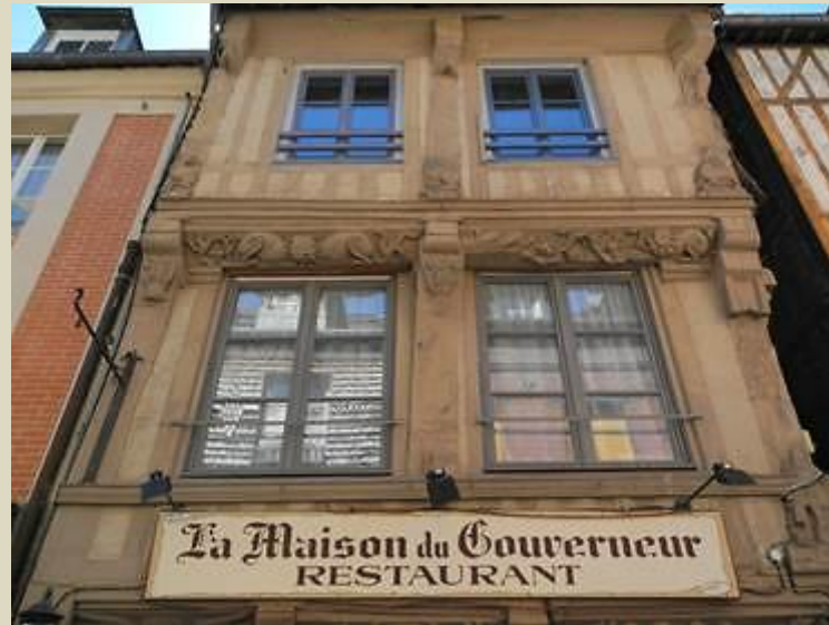
La rue Haute