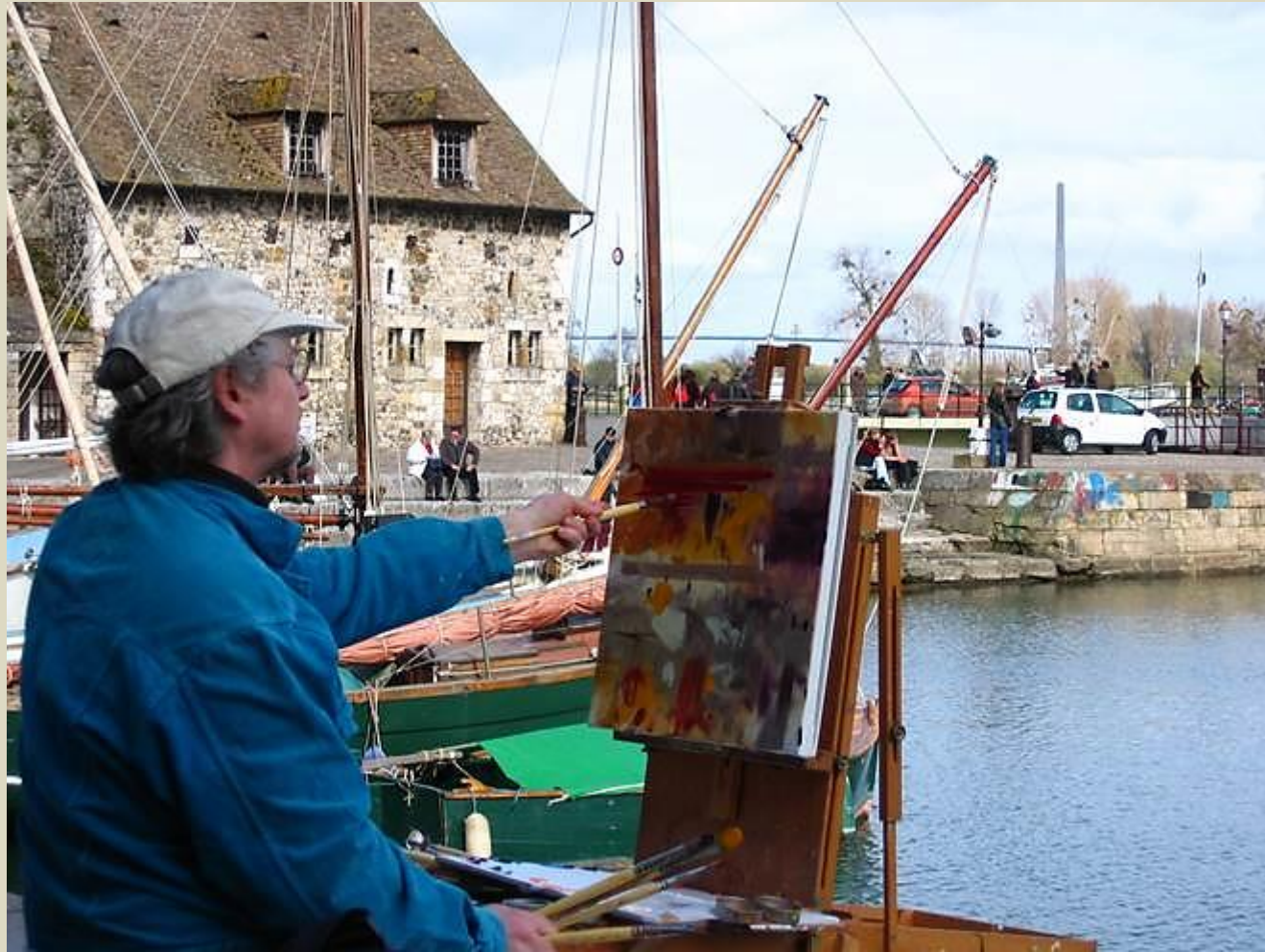
Le vieux port est un lieu incontournable pour les peintres qui viennent à Honfleur.