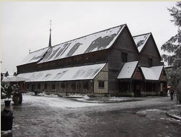
L'église sainte Catherine par tous les temps