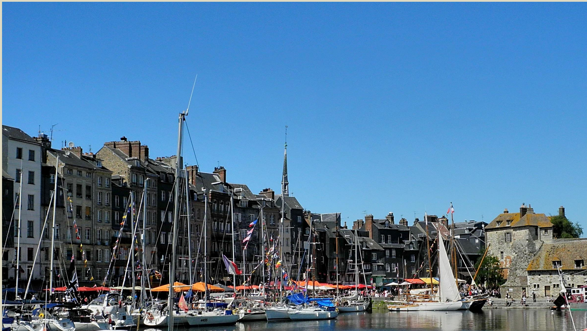
Le vieux port

L a Lieutenance (16 e /17 e ), à droite, flanquée de tourelles d'angle fut la résidence du lieutenant du roi, gouverneur d'Honfleur.